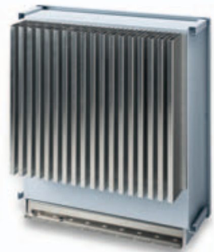
Äußerst robust: SINVERT PVM Wechselrichter verzichten auf externe Lüfter.